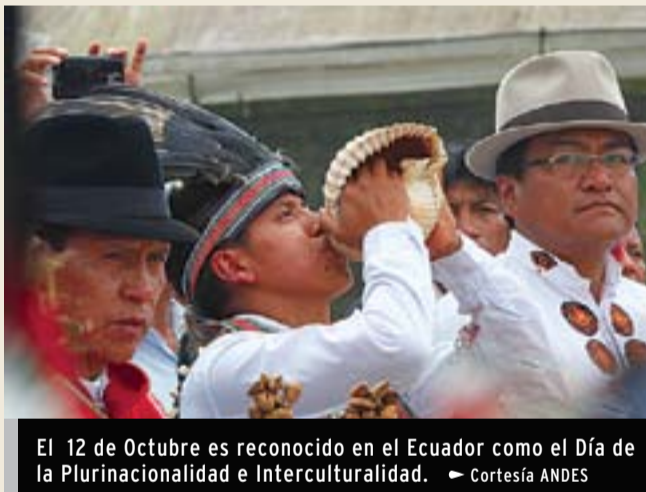
El 12 de Octubre es reconocido en el Ecuador como el Día de la Plurinacionalidad e Interculturalidad.

Cuenca. Hoy se cumple un año más de la Conquista de América, fecha bautizada luego como el Día de la Raza y, hoy por hoy, establecida en la Constitución como el Día de la Plurinacionalidad e Interculturalidad. Una necesaria reflexión desde la historia y la diversa postura de los nativos de la región. Este hecho para los movimientos indígenas no es un motivo de celebración, desde el arte es aprovechada como fecha simbólica.