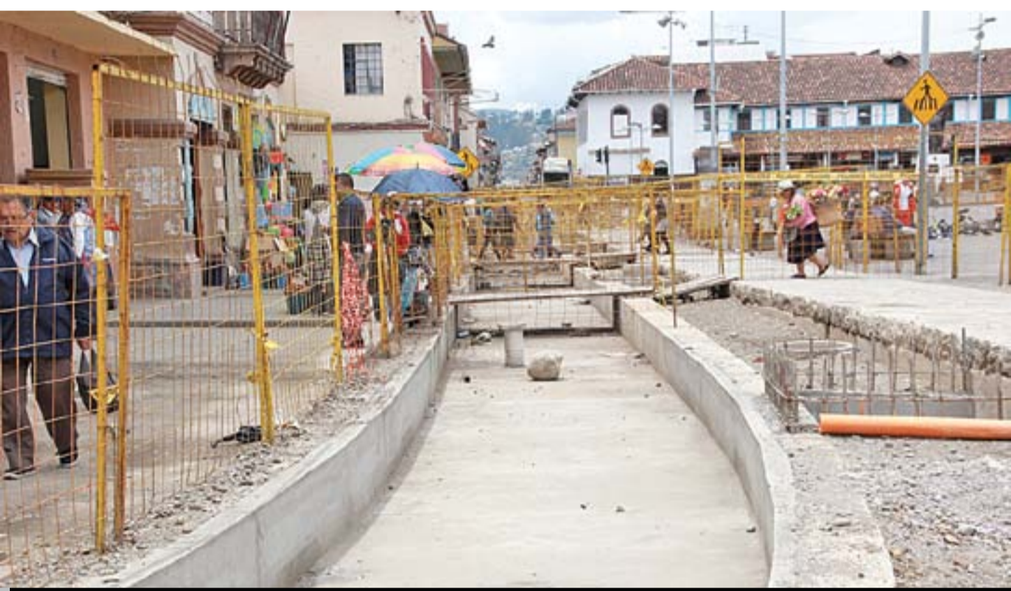
Las obras en el sector de la Nueve de Octubre serán prioridad para la nueva empresa.