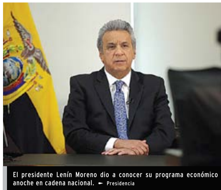
El presidente Lenín Moreno dio a conocer su programa económico anoche en cadena nacional.

Gestión | Se prioriza la creación de empleo y la producción | MÁS EN A7