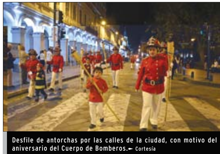
Desfile de antorchas por las calles de la ciudad, con motivo del aniversario del Cuerpo de Bomberos.